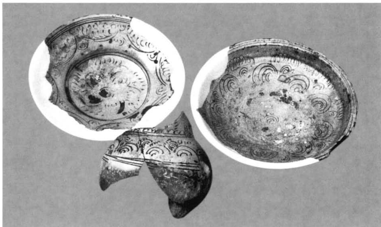
Εικ. 2. Εφνάλωμένα επιτραπέζια σκεύη με εγχάρακτο διάκοσμο.

στην κοιλιά. Η βάση τους είναι επίπεδη, με ή χωρίς δακτυλίσχημη προεξέχουσα απόληξη, ενώ η μορφή του λαϊμού τους παραμένει ασαφής, καθώς σε όλα τα παραδείγματα διατηρείται αποσπασματικά.