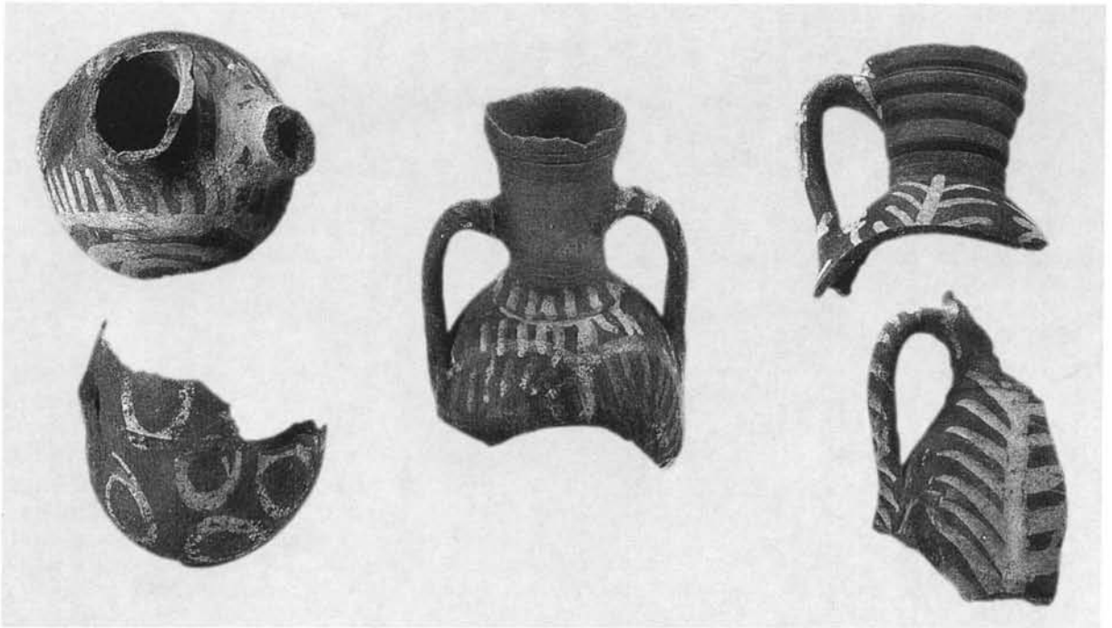
Εικ. 1. Κανάτια με λευκό ζωγραφιστό διάκοσμο.

στάσεων, και όπου η διαρκής διαχρονικά οικοδομική δραστηριότητα έχει ίσως εξαλείψει τα ίχνη τους. Το αριθ. 593 κανάτι της Αρχαιολογικής Συλλογής Μονεμβασίας, κακοποιημένο, ατελές (δεν έχει εφυάλωση) σκεύος, που βρέθηκε στο κάστρο, πρέπει να αναχθεί στην πρώιμη μεταβυζαντινή περίοδο και είναι μεμονωμένο εύρημα. Ελάχιστα λοιπόν στοιχεία μπορούμε να αναφέρουμε σχετικά με το θέμα της τοπικής παραγωγής κεραμικών, βασιζόμενοι κυρίως στις ομοιογενείς ομάδες κεραμικής που απαντούν στον οικισμό. Σε κάθε περίπτωση τα στοιχεία αυτά συνιστούν ενδείξεις και όχι αποδείξεις της λειτουργίας κεραμικών εργαστηρίων στο κάστρο ή στην ευρύτερη περιοχή του.